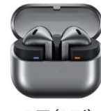
3등(3명) 삼성 갤럭시 버즈3