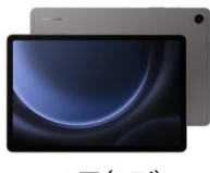
1등(1명) 삼성 갤럭시 탭 S9

*경품 추첨 이벤트에 참가하실 분들에게는 시상식에 반드시 참가하셔야 합니다.