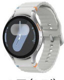
2등(2명) 삼성 갤럭시 워치7